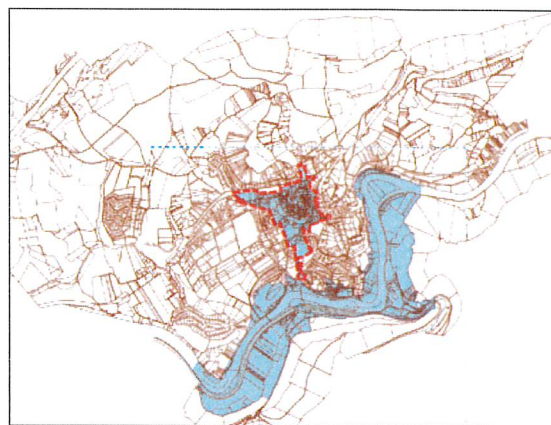
En bleu le périmètre général de l'AVAP, entouré en rouge le projet de périmètre de protection délimité des abords des monuments historiques.